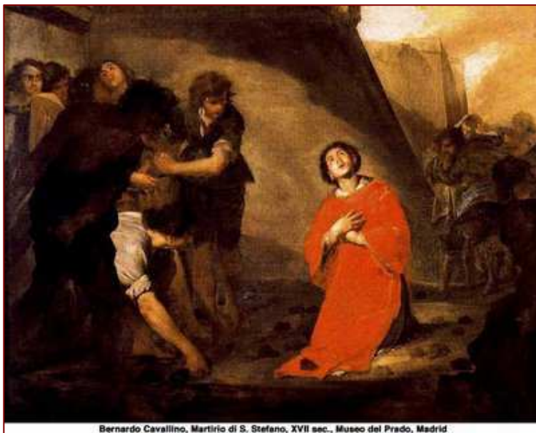
Bernardo Cavallino, Martirio di S. Stefano, XVII sec., Museo del Prado, Madrid

Nel brano evangelico leggiamo: Guardatevi dagli uomini. Questo significa che non dobbiamo isolarci, ma dare testimonianza di fede. Quando stiamo compiendo qualche cosa di buono, se crediamo in quello che stiamo facendo, anche se gli altri non ci apprezzeranno, continuiamo ad operare bene. La persecuzione ci porterà a purificarci. Quando le persone cercano di distruggere la nostra opera o vanificare quello che stiamo attuando, ricordiamoci che è proprio il seme gettato in terra, che porterà frutto. Con la morte di Gesù, tutto comincia, con la morte di Stefano, tutto comincia.